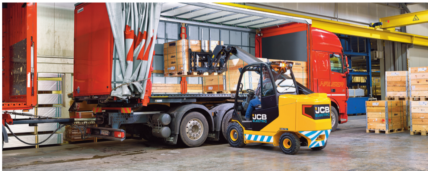
Dal 1997 il JCB Teletruk è l'unico carrello elevatore telescopico che grazie al braccio estensibile offre il vantaggio dello sbraccio anteriore

Svelato il nuovo JCB 30-19E, il primo modello elettrico della gamma JCB che apre nuove opportunità per una macchina che ha rivoluzionato l'attività dei costruttori, dei commercianti, dei porti, dei centri di riciclaggio e degli impianti industriali. Lanciato nel 1997, il JCB Teletruk rimane infatti l'unico carrello elevatore telescopico al mondo e, grazie al braccio estensibile, offre il vantaggio dello sbraccio anteriore. Ma se finora i Teletruk di JCB sono stati alimentati a diesel e GPL e utilizzati prevalentemente in applicazioni esterne, grazie alla sua alimentazione a batteria il JCB 30-19E è ora estremamente silenzioso e a